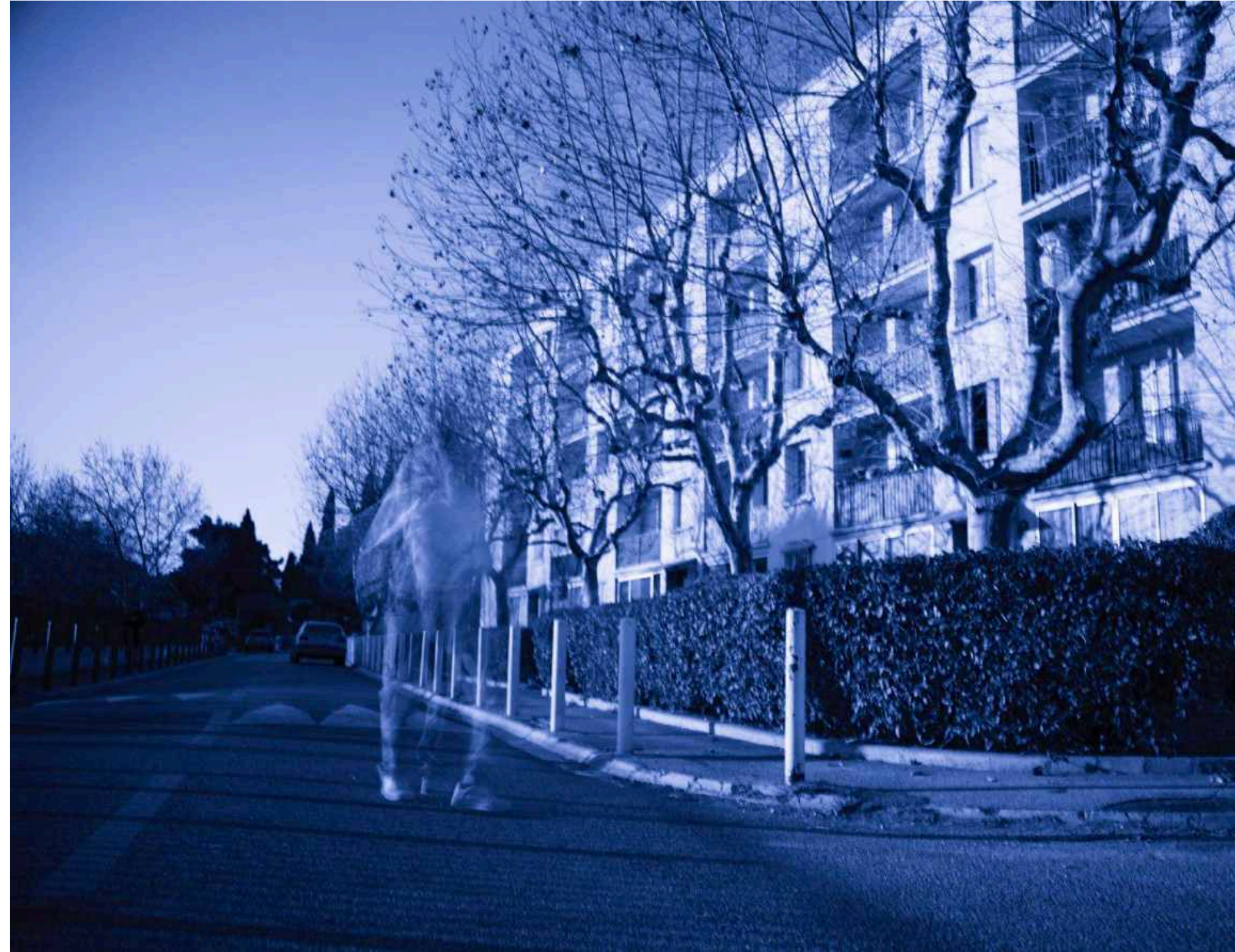
Saint Jean du Désert Marseille, 2023