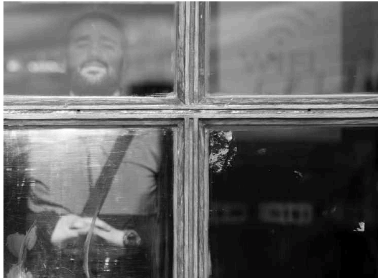
Saint Lazare, 3ème arr