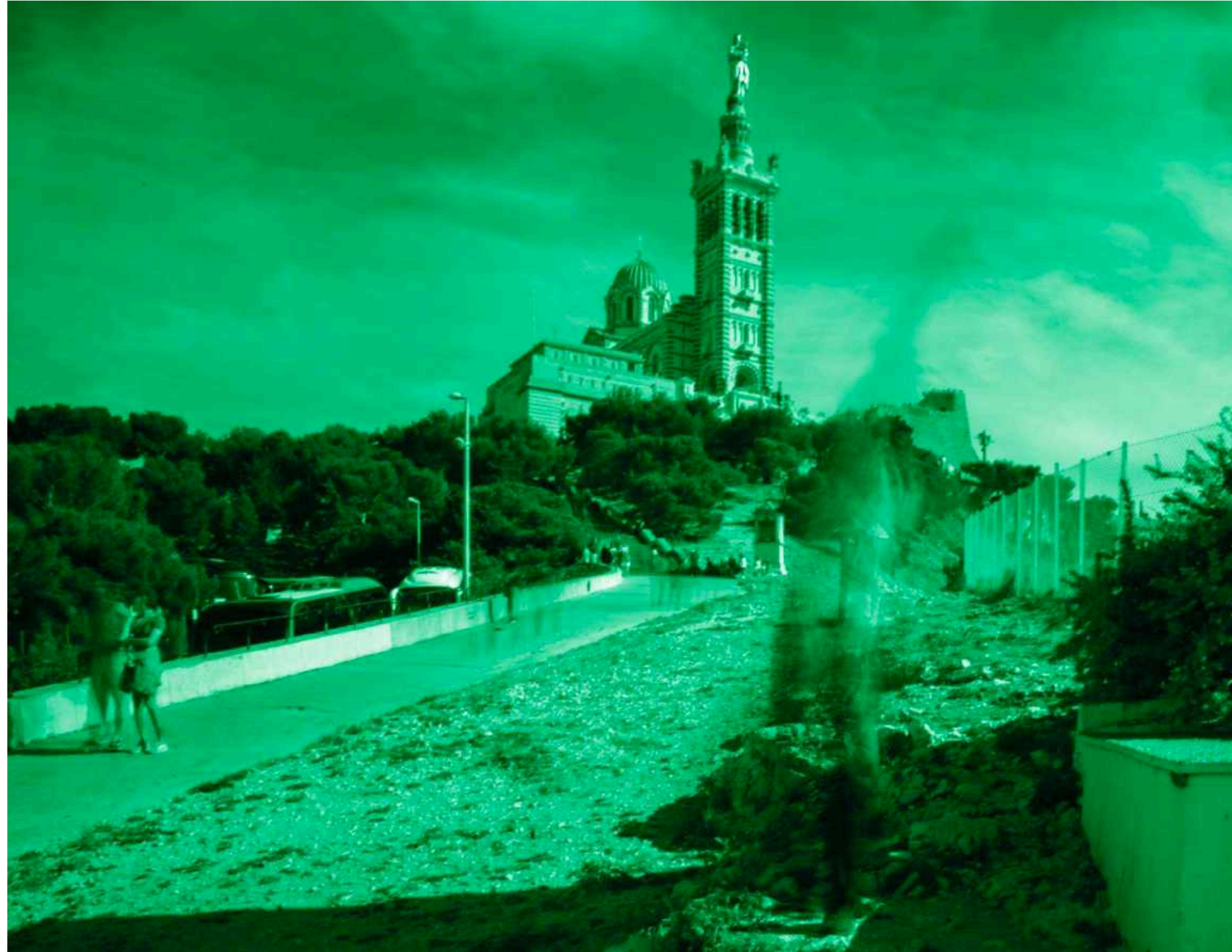
Notre Dame de la Garde Marseille, 2023