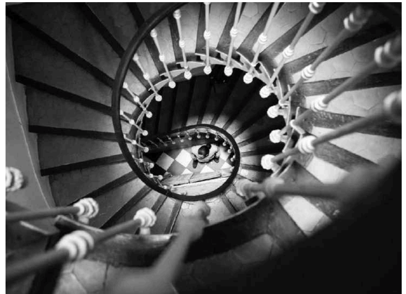
Vauban, 6ème arr