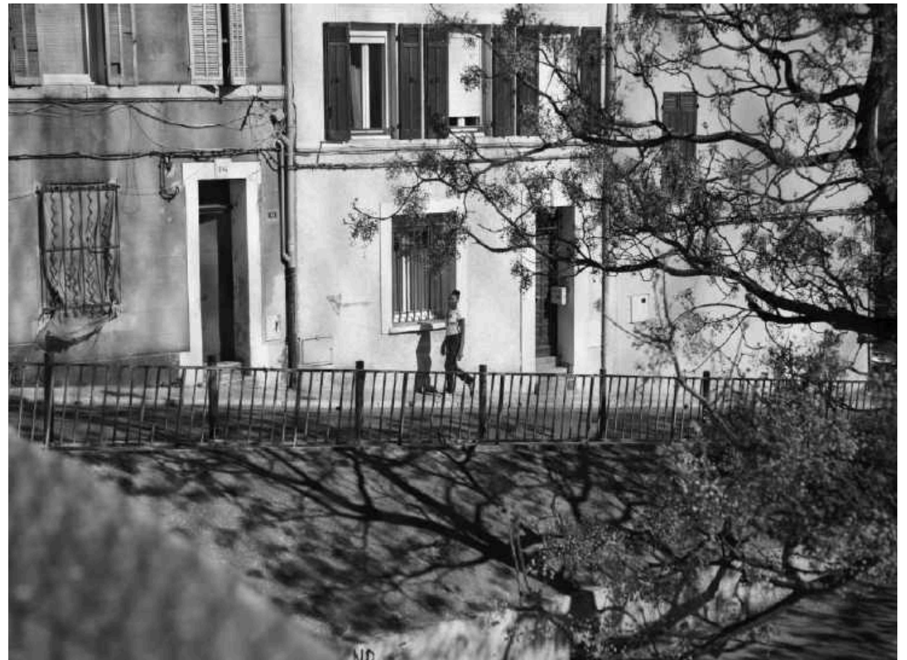
Belle de Mai, 3ème arr