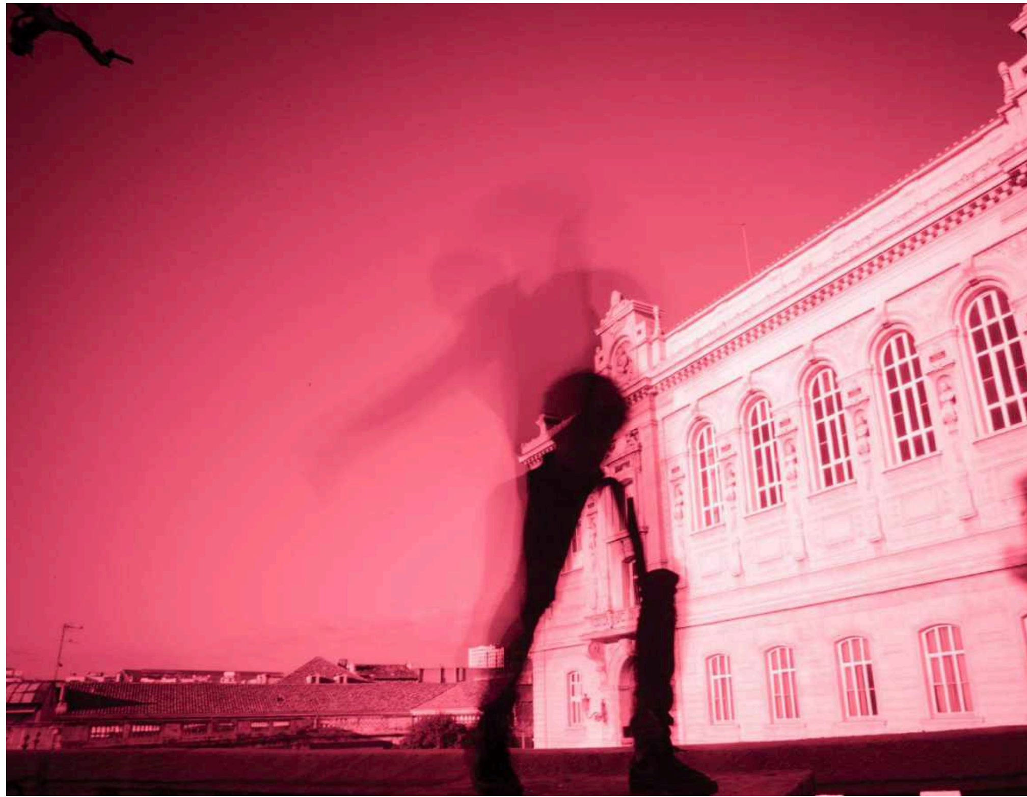
Conservatoire de Musique Marseille, 2023