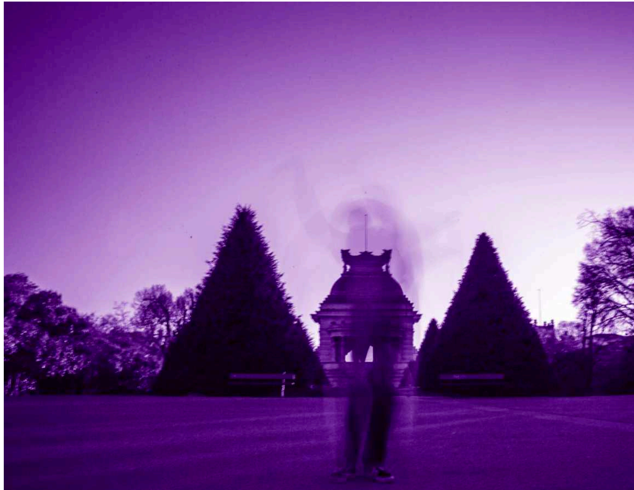
Parque Longchamp Marseille, 2023