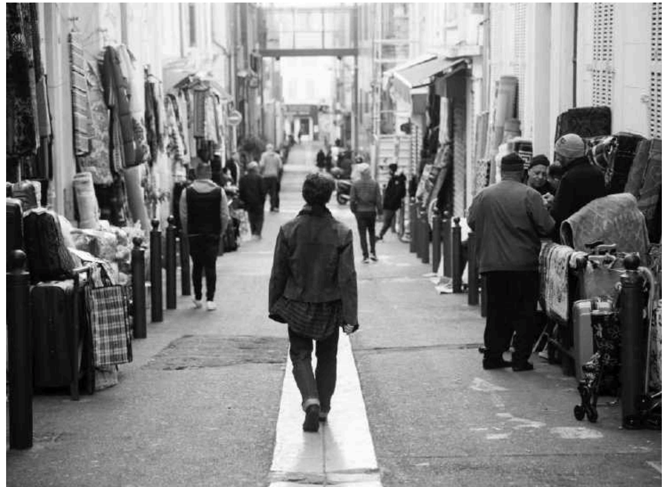
Belsunce, 1èr arr