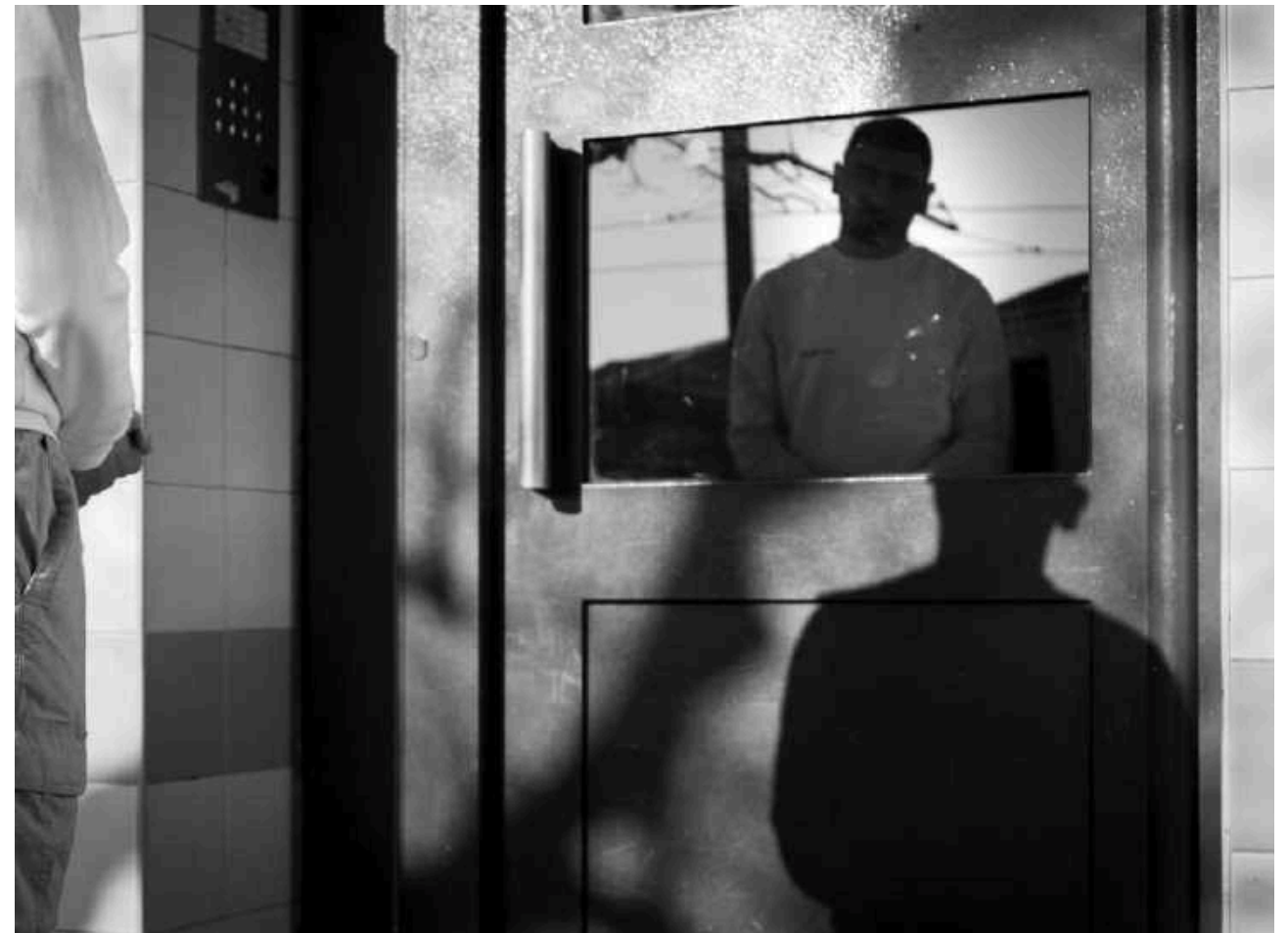
Blancarde, 5ème arr